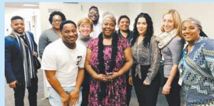
Algunos de los miembros del grupo asesor de NYCHA sobre Tabaco y Salud en una de sus reuniones.

También durante el verano, el personal de NYCHA y del DOHMH visitaron a 54 familias y promovieron la participación de más de 1,500 residentes para conocer más acerca de sus preguntas, ideas y preocupaciones con respecto a la política libre de humo de tabaco. En marzo y abril, se celebraron reuniones comunitarias en los cinco municipios con representantes del DOHMH y la Autoridad se está reuniendo actualmente con las