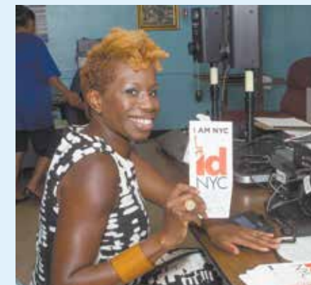
La Presidenta de NYCHA Shola Olatoye en el centro temporal de inscripción de IDNYC Pop Up en Sedgwick Houses en 2016.

POR CUARTO AÑO , IDNYC, el programa de identificación local más importante de la nación, es gratuito y está disponible para todos los residentes. Más de 1.2 millones de titulares de tarjetas IDNYC están conectados con servicios de salud y de la ciudad, actividades asequibles para toda la familia, instituciones culturales, actividades recreativas y de entretenimiento. Este año, IDNYC ha agregado nuevos asociados que ofrecen beneficios, entre ellos: Aviator Sports and Events Center, Chelsea Piers Golf Club, Chelsea Piers Sky Rink, Entertainment Cruises,