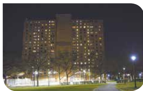
Nueva iluminación exterior, como la que muestra esta imagen del residencial Castle Hill Houses en el Bronx, es una de las herramientas utilizadas como parte del programa MPA para aumentar la seguridad en los vecindarios

Hasta la fecha, $140 millones del Concejo Municipal y la Portavoz, la Oficina del Alcalde y la Oficina del Fiscal de Distrito