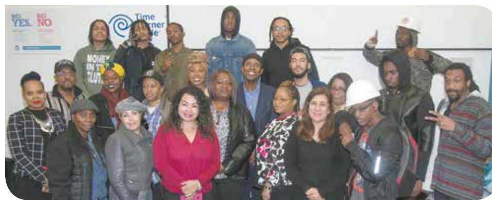
Los 23 residentes que se graduaron en la primera clase del programa de NYCHA Pathways to Apprenticeship celebran la finalización exitosa del programa con una ceremonia celebrada en Red Hook Initiative.

La Oficina de Recuperación y Resiliencia de NYCHA (NYCHA