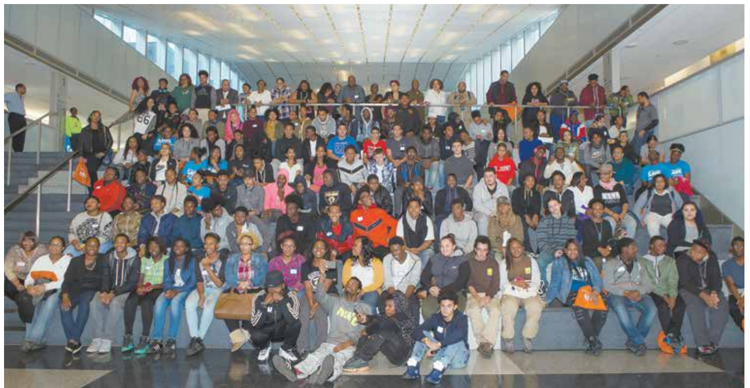
La primera Cumbre del Consejo de Liderazgo Juvenil de NYCHA fue un éxito con la participación de más de 130 residentes jóvenes de NYCHA. Año Nuevo, grandes cambios