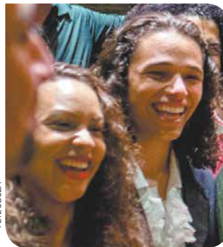
Anthony Ramos (a a derecha) con su antigua compañera de elenco Jasmine Cephas Jones Hamilton castmate Jasmine Cephas Jones.

La última presentación de Ramos en el escenario de Hamilton fue el 20 de noviembre. Pasará a protagonizar la nueva