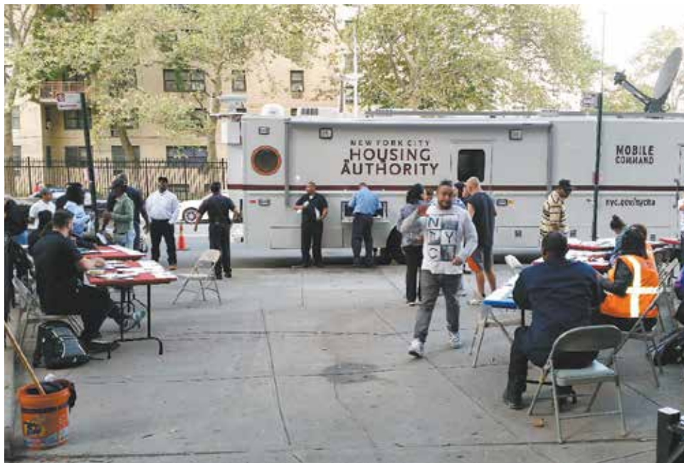
El autobús de Comando de NYCHA estacionado en el residencial Baruch Houses en Manhattan como parte de la Iniciativa de Pedidos de Trabajo de la Oficina de Administración de Propiedades de Manhattan para reducir el tiempo de respuesta en seis residenciales.

L A OFICINA DE Administración de Propiedades de Manhattan (MPM, por sus siglas en inglés) de NYCHA está adoptando un nuevo enfoque para mejorar el tiempo de respuesta para mantenimiento y reparaciones utilizando el autobús de Comando de NYCHA como una oficina centralizadora para gestionar los pedidos de trabajo.